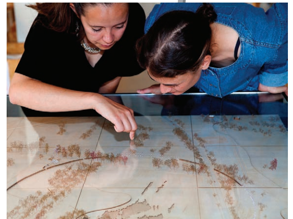
De to arkitektstuderende bag modellen Solvognens fundsted. Her i gang med at udvikle ideen

Hele den fortælling, der knytter sig til fundet i Trundholm Mose, bidrager med et vigtigt afsnit i både kultur- og landskabs-historien. Med udgangspunkt i det unikke bronzealderfund, der overhovedet vurderes til at være Europas vigtigste, vil man som besøgende på fundstedet samtidigt kunne opleve landskabets udvikling fra istiden og frem til nu.